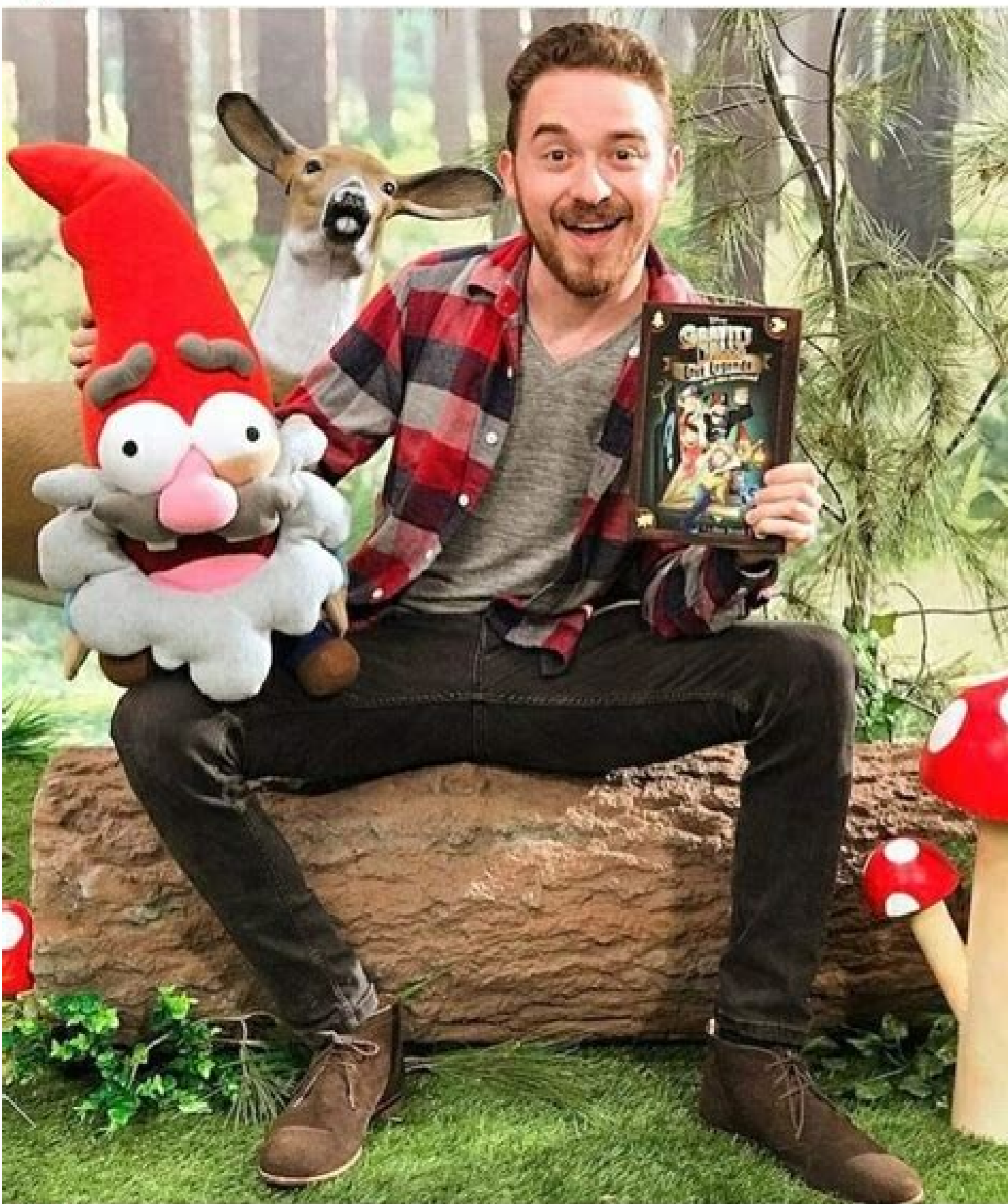
Liked by danaterrace, thatgffan and 14,113 others _alexhirsch_ BUY MY BOOK OR ILL DROWN THIS GNOME https://books.disney.com/book/gravity-falls-lost-legends/